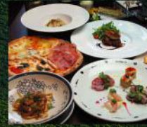
(写真はイメージです。)