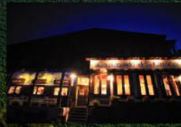
会場はピットーレ岩原本店

イタリアでも有名な糸杉の並木道(この並木道は海に伸びています)まで来ると、その左側終点がボルゲリ村です。そこで造られているグラッタマッコこそ「スーパー・タスカン」と呼ばれ、サッシカイアやオルネライアなどと並び称される世界最高峰のワインなのです。